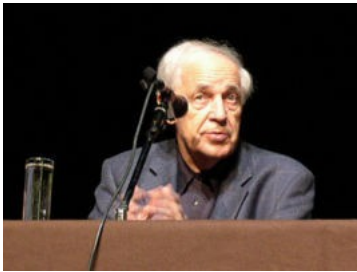
Pierre Boulez (1925)

Tıpkı toplum-bilim ve demokrasi anlayışımızda Hitler'in yükselişinin ve şartlarının, belki olayların dışında yaşamış olduğumuz için, belki de kasten, net olarak bilinmemesi ve bundan ders alınmaması gibi, Batı Müziğinde de bilinen eski-yeni oluşumlardan uzak biçimde yetişmekte yaşamaktayız.