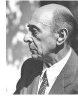
Arnold Schoenberg (1874-1951)

Bu akımların sonucu olarak ortaya çıkan müzikler hiçbir yapısal bütünlük ve düşünsel çalışma içermeyen, sığ tınısal oluşumlardır. “Ezla entelektüel biçimde müzik yazıyorsunuz” denildiğinde, Schönberg, “Ezla gibi müzik yazmaktansa entelektüel gibi müzik yazmayı yeğlerim” dem...