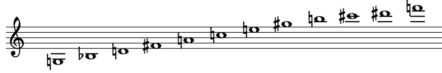
The original Tone-Row by Alban

This piece, just like the other ones in the series: Kaleidoscopes 2 , is based on the original tone row by Alban Berg as used by him in his violin concerto To The Memory of an Angel . The row is used here, for its intervals being very close to minor chords. The tone-row is not employed here by strictly applying the 12-Tone music rules . Rather, the row and its various derivatives (retrograde and reverse forms as well as its transpositions) are used here by freely mixing them.